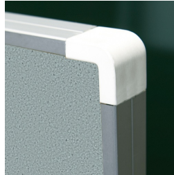
Kantenschutz durch gerundete „Sicherheitsecken“