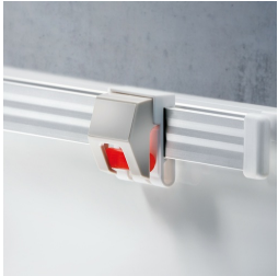
Optional mit Bilderklemmleiste