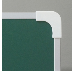
Kantenschutz durch gerundete „Sicherheitsecken“