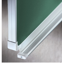
Passende Ablageleiste für Kreide und Stifte