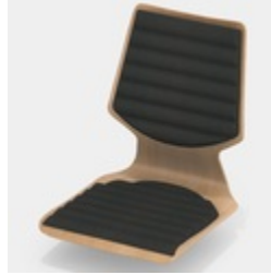
Inklusive Sitz- und Rücken-Wellenpolster