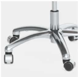
Absolut robustes Alu-Fußkreuz