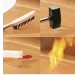
Unverwüstliche PAGHOLZ®-Schale, kratz-, bruch-, stoßfest & schwer entflammbar