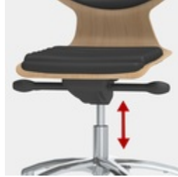
Höhenverstellung durch Sicherheitsgasfeder