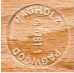
PAGHOLZ® aus nachhaltiger Forstwirtschaft