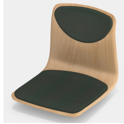
Optional mit Sitz- und Rückenpolster (nur Gr. 6E, 7)