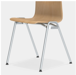
Robustes 4-Bein Gestell