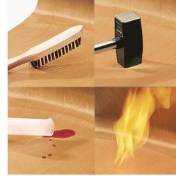
Unverwüsthliche PAGHOLZ®-Schale, kratz-, bruch-, stoßfest und hitzebeständig