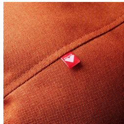
Langlebige Qualität durch hochwertige Verarbeitung