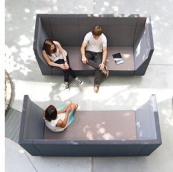
Ideal als Raum-in-Raum Lösung