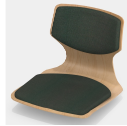
Optional mit Sitz- und Rückenpolster (nur Gr. 6E, 7)