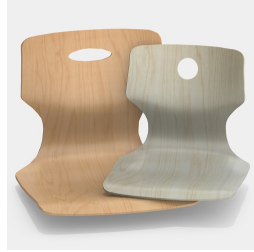
Optional mit Griffloch, rund oder oval