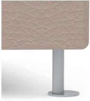
Stabiles Rundrohrgestell optional verchromt