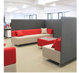
Durch verkettbare Elemente individuell erweiterbar