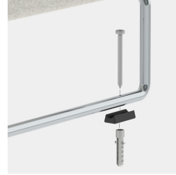
Optional mit geschraubter oder geklebter Bodenbefestigung