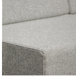
Langlebige Qualität durch hochwertige Verarbeitung