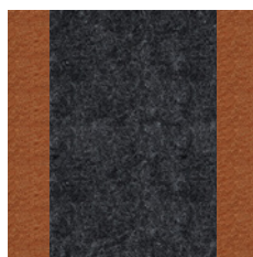
Kupfer und Anthrazit