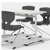
Sièges des deux côtés grâce au cadre de la colonne centrale