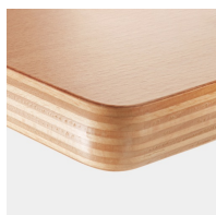
Option : plateau multiplex revêtu de mélamine