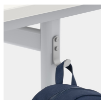
Comprend un crochet pour dossier par siège