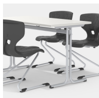
Sièges des deux côtés grâce au cadre de la colonne centrale