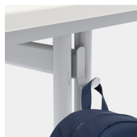
Comprend un crochet pour dossier par siège