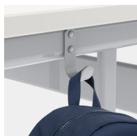
Comprend un crochet pour dossier par siège