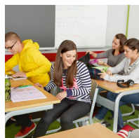
La forme en C permet de ne pas gêner les pieds de la table lors de la montée et de la descente de celle-ci.