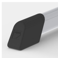
Protections de sol avec protection intégrée des marches