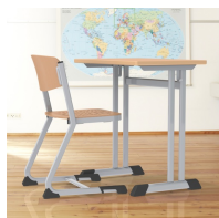
La forme en C permet de ne pas gêner les pieds de la table lors de la montée et de la descente de celle-ci.