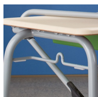
Barre d'empilage avec crochets pour dossiers des deux côtés