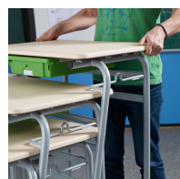
Jusqu'à 4 tables empilables, également avec des accessoires