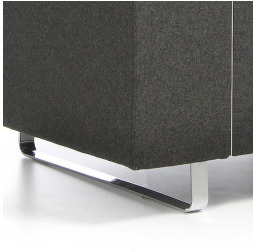
Cadre stable pour les patins