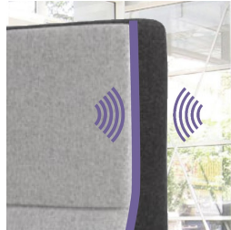
Isolation phonique grâce à la mousse insonorisante du dossier.